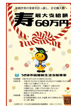
結婚新生活支援事業の広報用 ポスター(福岡県うきは市)