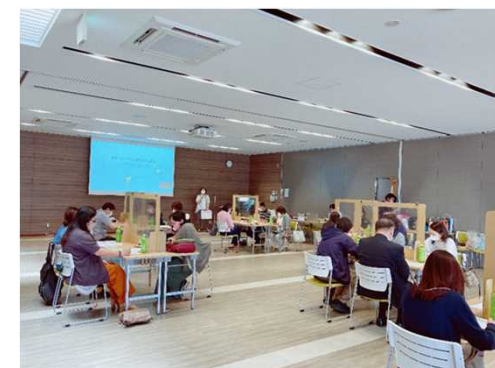
ボランティア研修会の様子(愛媛県)