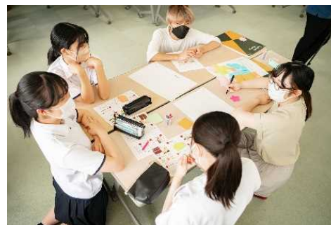
ライフデザイン講座の様子 (群馬県)