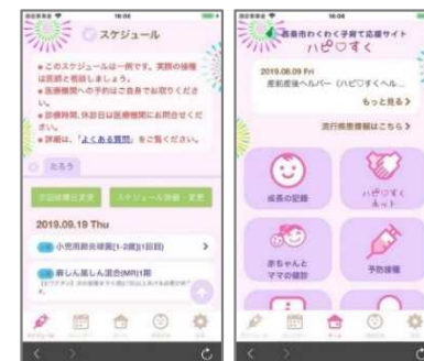
子育てモバイルサービスの運営 (愛媛県西条市)