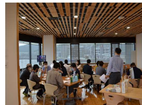
婚活イベントの様子(長崎県)