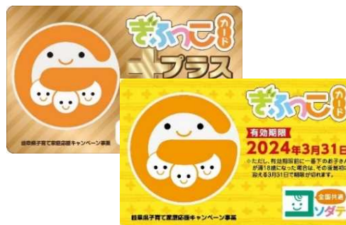
子育て支援パスポート「ぎふっこカード」 (岐阜県)