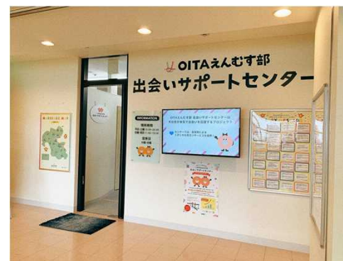
大分県結婚支援センター 「OITAえんむす部 出会いサポートセンター」