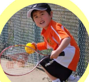
テニススクールプリマステラ