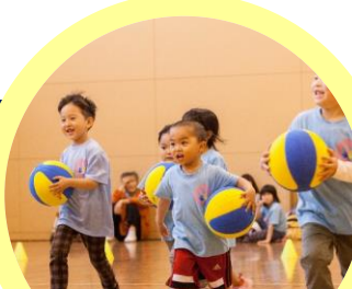
多種目スポーツスクール JJMIX