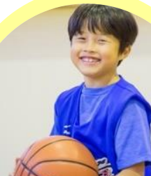
バスケットボールスクールハーツ