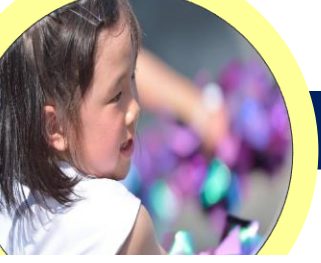
チアダンススクールフルール