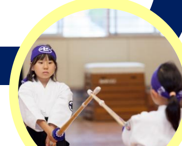
こころ剣道スクール