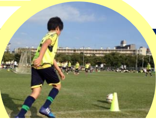
リベルタサッカースクール