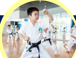
リズムミックカラテクオレ