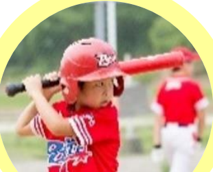
ベースボールスクールポルテ