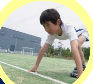
テリオスアスレチックスクール