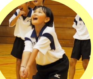
バレーボールスクールルミゼ