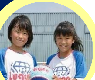
ルジーナガールズ スポーツスクール